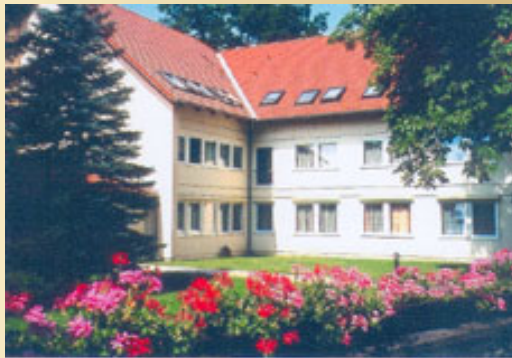
Mutterhaus und Schwesternwohnhaus ab - 2001

Am 8. September 1991 waren wir wieder e i n e Provinz Berlin.