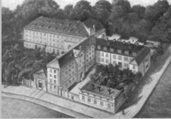
Das Breslauer Mutterhaus vor der Zerstörung am 2. April 1945

In Schlesien begann die Massenflucht vor der herannahenden sowjetischen Armee.