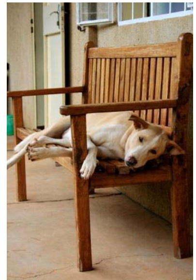
Karusch auf seinem Lieblingsplatz