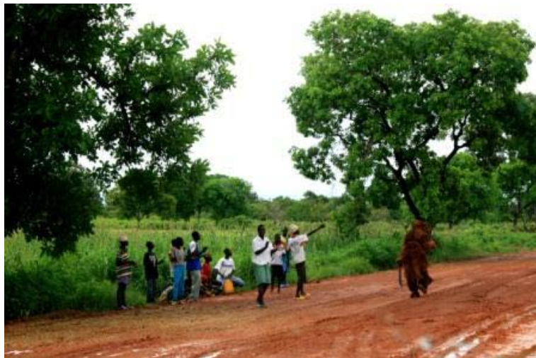
Ein Kankuran tanzend auf der Strasse und hinter ihm eine Traube von Jungs

Sie erzählte weiter, dass an manchen Mangobäumen ein rotes Band hängt, diese dürfen auf keinen Fall angefasst werden, da sie von Kankurans bewacht werden, bis die Früchte reif sind.