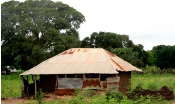
Eine Hütte (= Haus) in Gambia

anscheinend auch nicht soo oft vor). Strom haben wir hier nur für ein paar Stunden am Tag (ca. vier Stunden am Vormittag und dann ab 18 Uhr wieder).