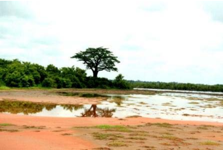
Gambia in der Regenzeit

Ganz ganz liebe Grüße aus dem fernen und heißen Gambia!