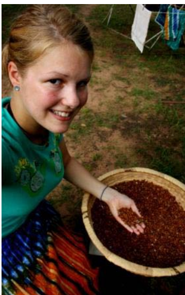
Ich mit meinem neuen „Lappa“ und den gepulhten Bohnen in der Hand

Ab Oktober beginnt dann die Trockenzeit (bis Mai) und ab Dezember soll es dann etwas kühler werden.....kann ich mir fast nicht vorstellen =)