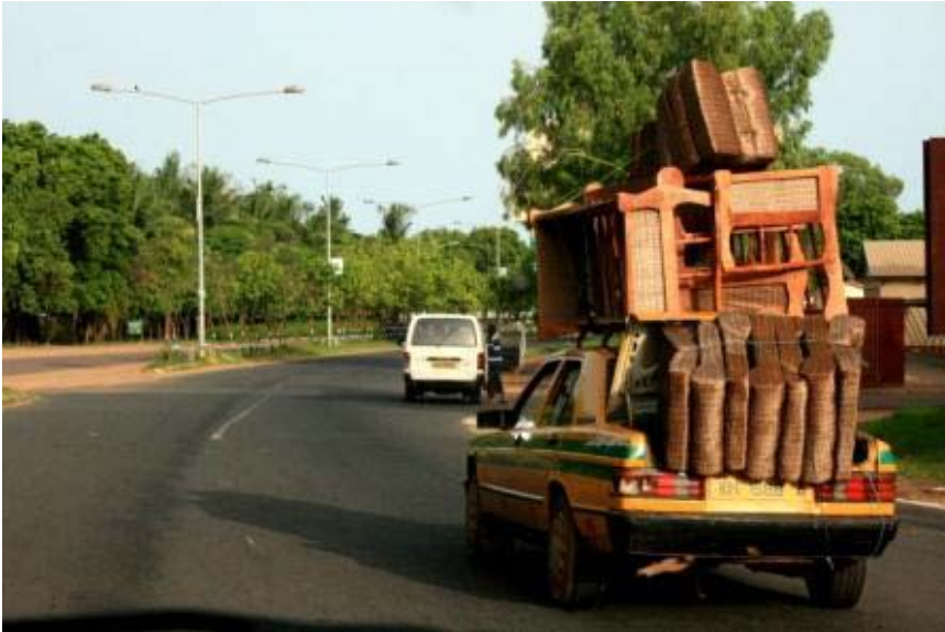
Kein Platz mehr?? No problem, das Wohnzimmer passt auf's Taxidach!!!

Zu Hause angekommen habe ich sofort angefangen mein endlich vorhandenes Gepäck auszupacken. Es ist wirklich kein Vergnügen 13 Volleybälle und 3 Fußbälle bei ca. 36 Grad Celsius (gefühlte 45 Grad) aufzupumpen! Am Ende war mein „Geschenkebett“ jedenfalls total überladen...immerhin hatte ich in meinen Taschen neben den Bällen auch noch ein Volleyballnetz, Ballpumpen, einen Berg-kalender, zwei Angeln mit Zubehör, ca. 50 selbstgenähte (gespendete)