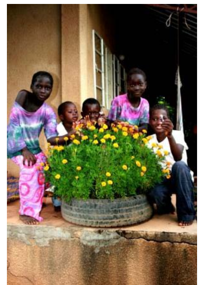
Unsere Mädls, die ganz stolz ihre Blumen präsentieren