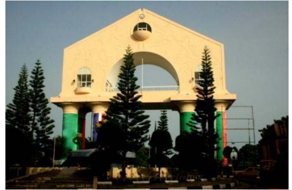
Banjul, die Hauptstadt Gambias