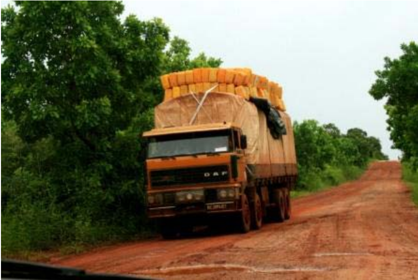
Ein ueberladener Lastwagen auf der ultra schlechten Strasse in Richtung Soma

Am nächsten Tag ging es früh morgens mit dem Auto nach Jerre Soma. Als wir den Bezirk rund um Banjul verlassen hatten, wusste ich auch warum mich die Schwestern zuvor beim Frühstück gefragt hatten, ob ich fit für die Autofahrt sei. Die Straße ist wirklich in einem miserablen Zustand (vor allem in der Regenzeit). Überall roter Sand und wegen der vielen „Flüsse“ die sich durch den Regen gebildet hatten, war der „Seegang“ ziemlich heftig. Aber