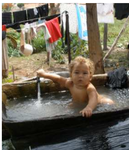
Hier wird normalerweise Waesche gewaschen :)