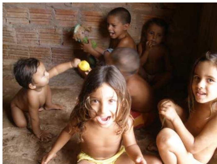
spielende Kinder in Paulo Ramos

Am Tag der Abreise waren dann alle sehr traurig und ich natuerlich auch. Es waren 2 unvergessliche Wochen.