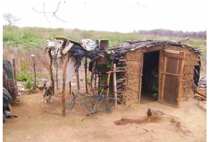
“Wohnhaus” in einer der aermsten Siedlungen