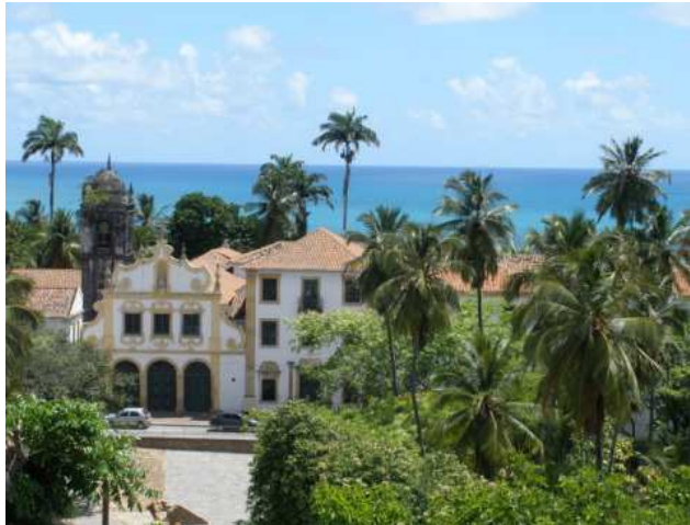
Aussichtspunkt in Olinda

Wir haben eine schoene Woche erlebt und viel von Recife und Olinda gesehen. Wir haben auch einen der beruehmtesten Straende im Nordosten besucht: Ponta de Galinhas, was sich als echt wundeschoen herausgestellt hat.