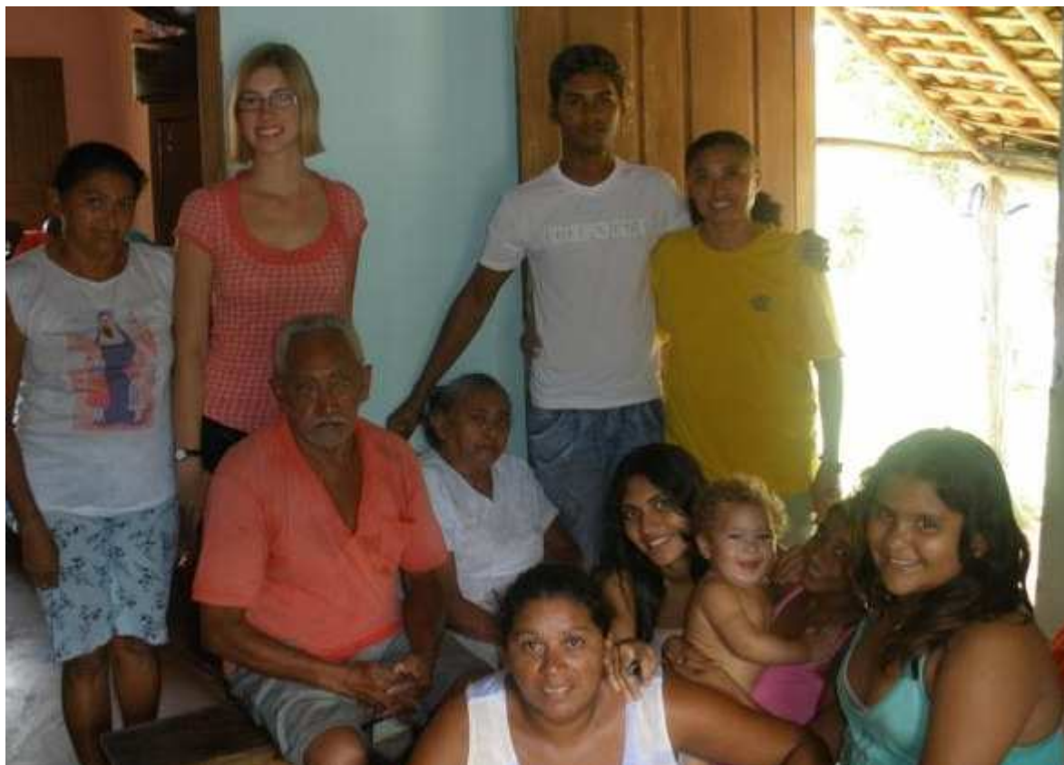
Die ganze Familie zusammen. (nur der Onkel gehoert eigentlich nicht auf's Bild. Aber wir konnten ihn schlecht auffordern bitte zu gehen, hehe)