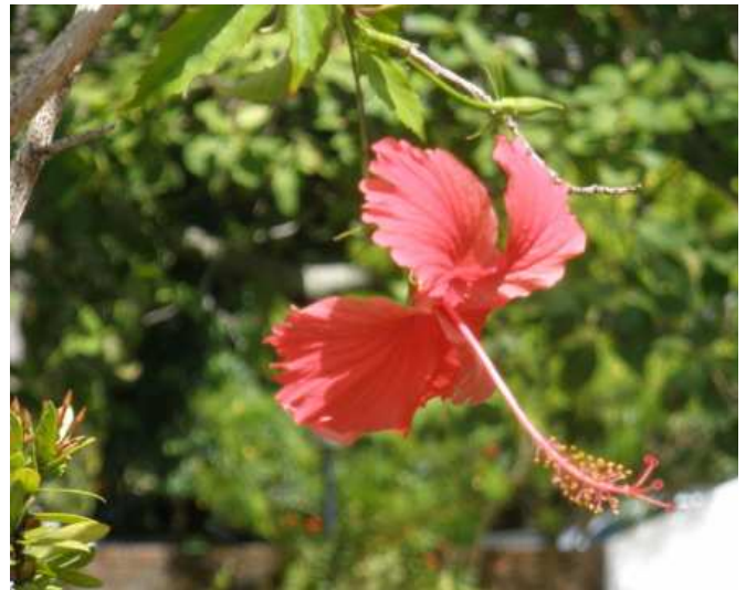
Blumenpracht in Ponto de Galinhas