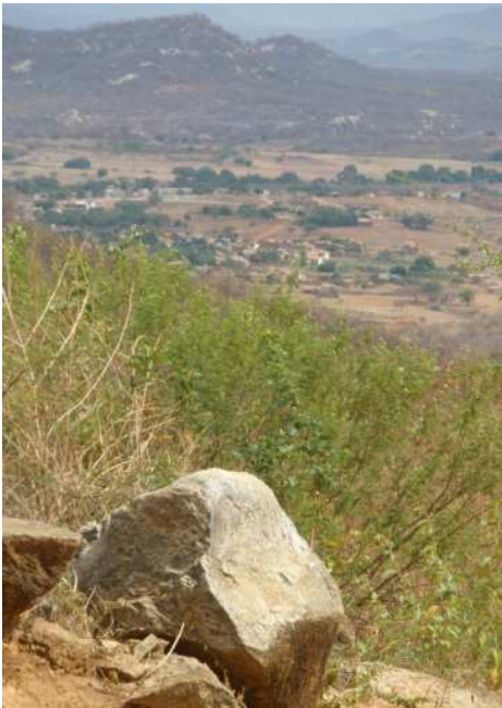
Momentane Landschaft in Paraíba. Wenn bald die Regenzeit einsetzt, wird die Farbe Gruen dominieren.