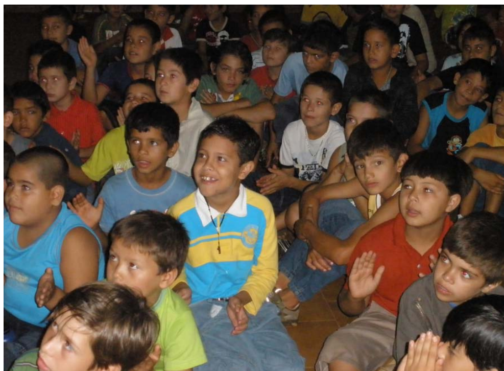
Die Jungs morgens bei der Eroeffnung

Leiterrunde, um noch einiges organisatorisches zu klaeren. In der Zwischenzeit versammelten sich alle Kinder in der grossen Halle, wo jeder Tag gemeinsam begonenn wurde. Mit Gebeten, Liedern und ganz viel Freude.