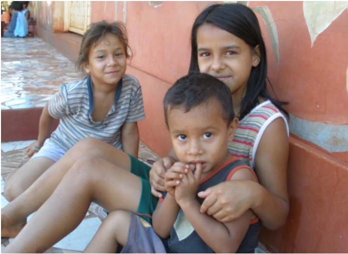
Kinder in Paraguay