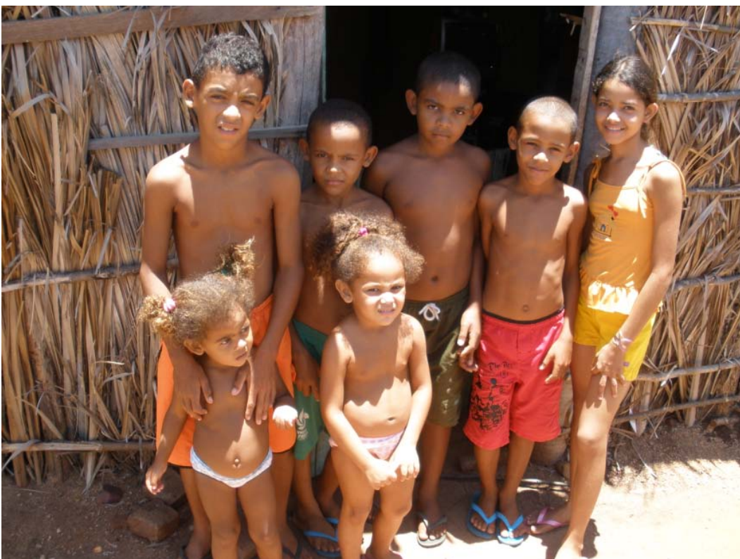
Kinder in einer der Siedlungen

Die Freitage sind dann komplett frei gehalten, um die Siedlungen der landlosen Bevoelkerung zu besuchen.