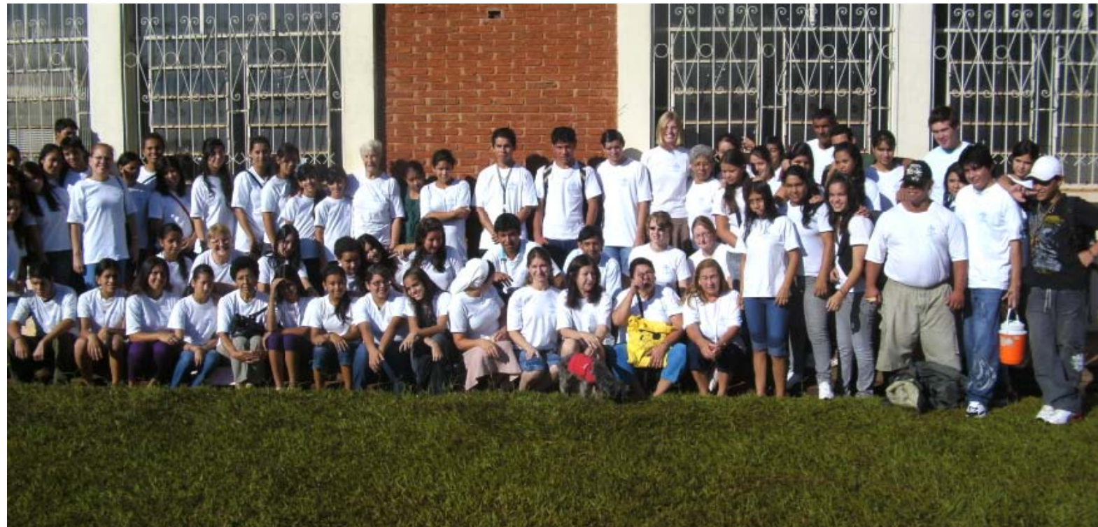
Alle 90 Leiter auf einem Haufen

Die Gruppenleiter haben die gesamten 2 Wochen ihre Gruppen begleitet und zu den jeweiligen Attraktionen gefuehrt. Die Leiter eines bestimmten Themengebietetes waren immer an der gleichen Stelle, um dort die verschiedenen Kinder in Empfang zu nehmen.