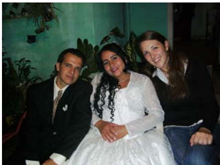
Das Brautpaar und ich