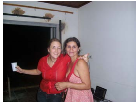
Die Pfarrersköchin und ich waren aber auch, trotz fehlenden Fingernagels, gut gelaunt

Nun gut mit diesem Abendessen war nun auch der Mai gekommen und die Temperaturen werden merklich frischer. Nachts kühlt es bis zu 13 Grad ab und wenn die Sonne am Tag nicht scheint ist es einfach bitterkalt. Sobald die Sonne aber da ist, kann man schon wieder im T-Shirt draussen sein. Das perfekte Erkältungswetter eben. Um Mein Abwehrsystem gegen Grippe usw zu schützen habe ich daher Folgendes für mich entdeckt. Immer wenn ich Zeit habe, mal wieder durchgefrorene bin und nicht wie der Rest Paraguays mir einfach die Decke über den Kopf ziehe und schlafe, ziehe ich mich gut an, gehe zum 5 Minute entfernten Justizpalast und jogge dort 10 Runden. Nach dieser halben Stunde Bewegung, friere ich dann meisten nicht mehr, habe im Gegensatz einen hochroten Kopf und kann dann ohne Probleme unter unsere kalte Dusche stehen. Ich habe also nun doch noch einen