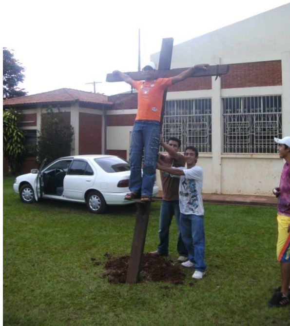
Die Jungs beim Kreuze aufstellen

Mit vielen Leuten an den Strassen oder hinter uns in einer Lichterprozession ging dann der 2-stündige Marsch durch die Strassen nahe der Kirche los. Immer wieder wurde angehalten und wir spielten eine der Kreuzwegstationen nach. Als Maria war meine Hauptaufgabe, bestürzt und traurig zu sein, meinen Sohn Jesus so gut wie möglich zu unterstützen und mich nicht von Johannes und Maria Magdalena trennen. ES klappte alles sehr gut, die Leute waren beeindruckt und alle waren sehr zufrieden als wir um 21.30 Uhr wieder in unseren normalen Klamotten steckten.