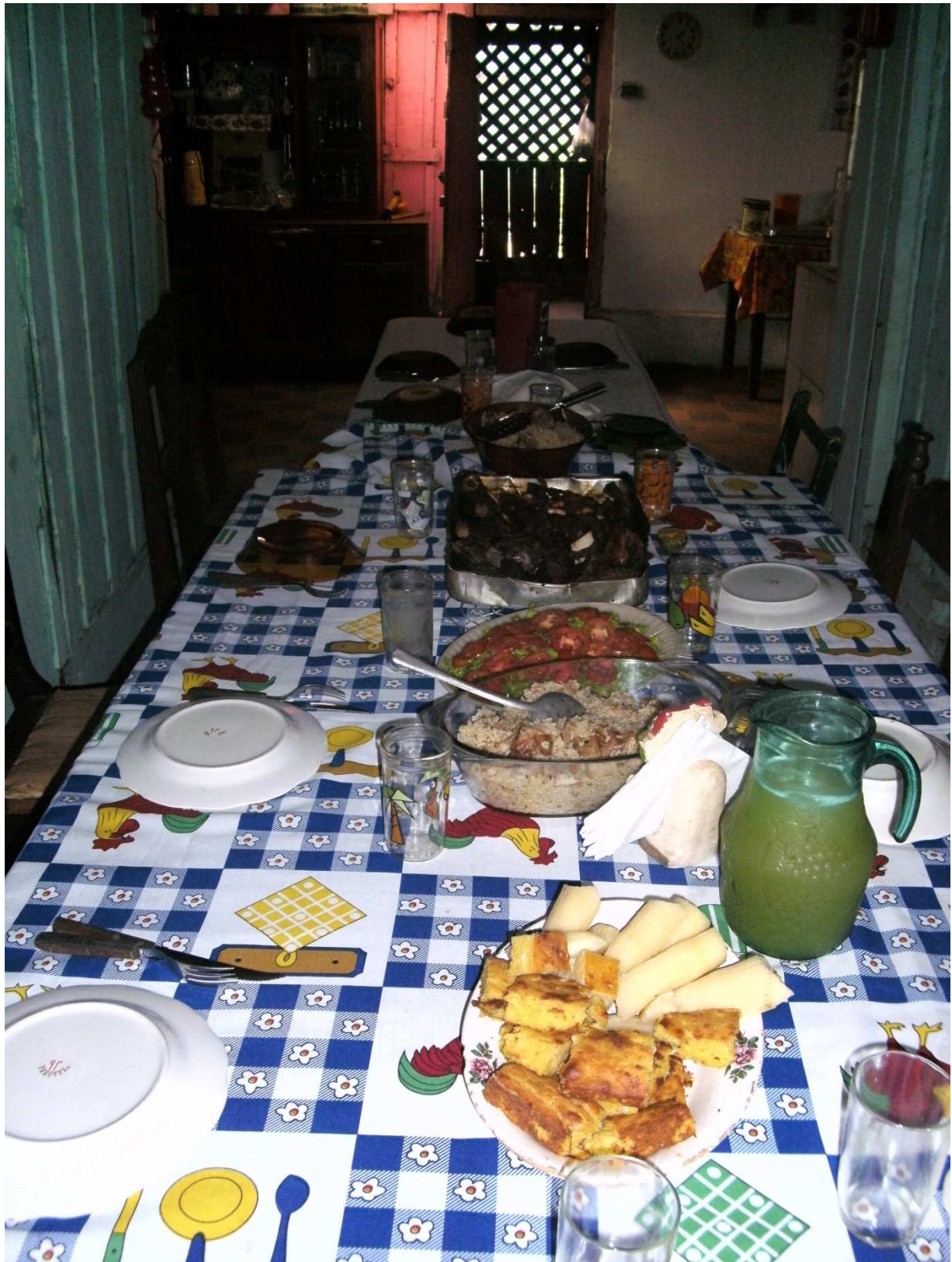
So sah mein Ostermahl aus

Mein Osterfest war also sehr anders als sonst. Es wurde zwar zum einen keinen so großen Wirbel und so total festlich gemacht wie ich es gewohnt war, zum anderen wurde aber die Sache Ostern, viel besser erklärt und veranschaulicht, als ich es bisher in Deutschland erlebt habe. Trotzdem freue ich mich schon auf nächstes Jahr, wenn ich wieder mit der Familie zwei Tage Süßigkeiten und andere Köstlichkeiten durcheinander essen werde, denn so ein Fest ist doch auch schön mit der Familie.