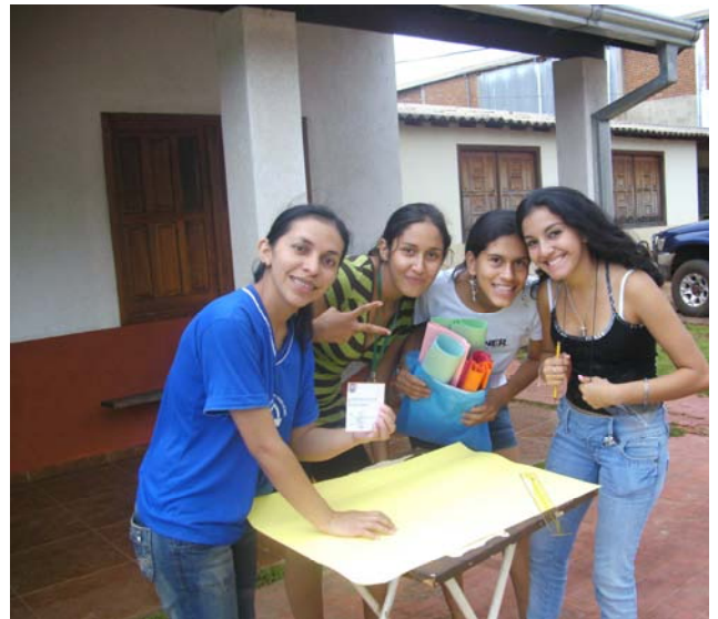
die Mädels beim Plakate malen

Mit vielen Leuten an den Strassen oder hinter uns in einer Lichterprozession ging dann der 2-stündige Marsch durch die Strassen nahe der Kirche los. Immer wieder wurde angehalten und wir spielten eine der Kreuzwegstationen nach. Als Maria war meine Hauptaufgabe, bestürzt und traurig zu sein, meinen Sohn Jesus so gut wie möglich zu unterstützen und mich nicht von Johannes und Maria Magdalena trennen. ES klappte alles sehr gut, die Leute waren beeindruckt und alle waren sehr zufrieden als wir um 21.30 Uhr wieder in unseren normalen Klamotten steckten.