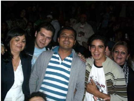
ein paar meiner Freunde

Wir ergatterten einen guten Platz ziemlich nahe an der Bühne. Wir waren alle in super Stimmung, konnten fast jedes Lied mitsingen und verbrachten so einen echt coolen Abend.