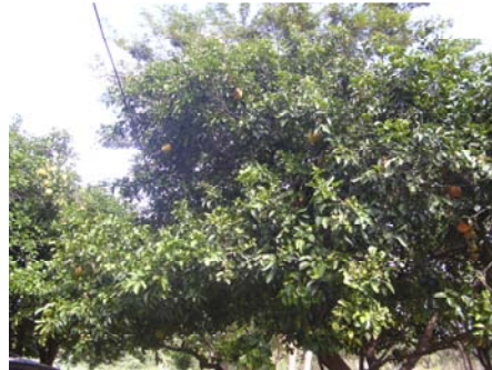
Wer kann die Grapefruits entdecken?