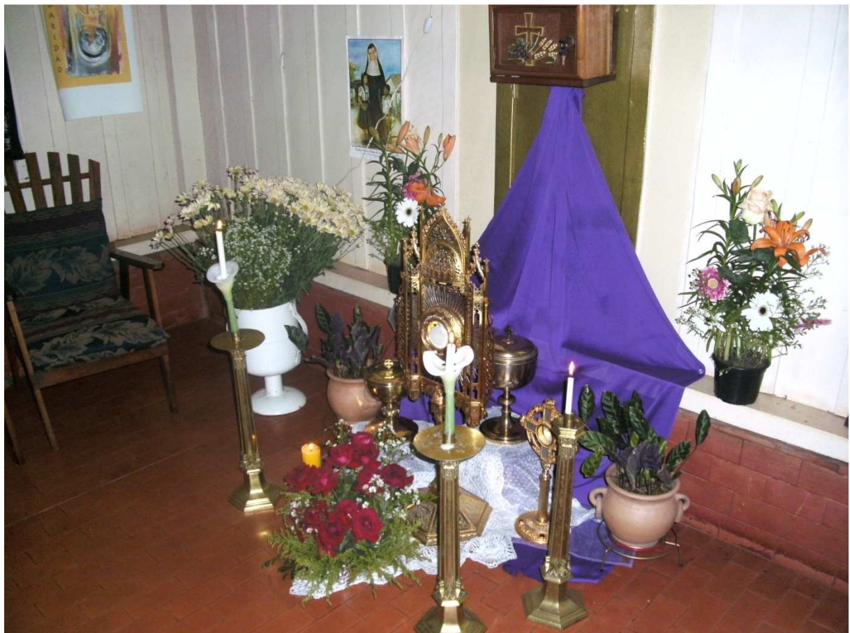
Das Allerheiligste in unserer kleinen Hauskapelle

Die Kartage und das Osterfest verlief für mich also dieses Jahr wie folgt: Am Gründonnerstag war eine festliche letzte Abendmahlmesse mit Fusswaschung und allem was dazu gehört. Danach wurde, wie ich das auch von Deutschland her kannte, alles was an Schmuck oder Dekoration erinnert weggeräumt und verstaut. Nach der Messe begannen Gebetsstunden. Von 23 bis 00 Uhr war die Jugendgruppe dran, die eine sehr schöne Meditation vorbereitet hatte. Wir waren eine gute Gruppe und verweilten eine Stunde vor dem Allerheiligsten, beteten, sangen und schwiegen. Danach brachten wir die große Monstranz und alle Blumen ,die vom Gottesdienst übrig geblieben waren, zu uns in die kleine Hauskapelle.