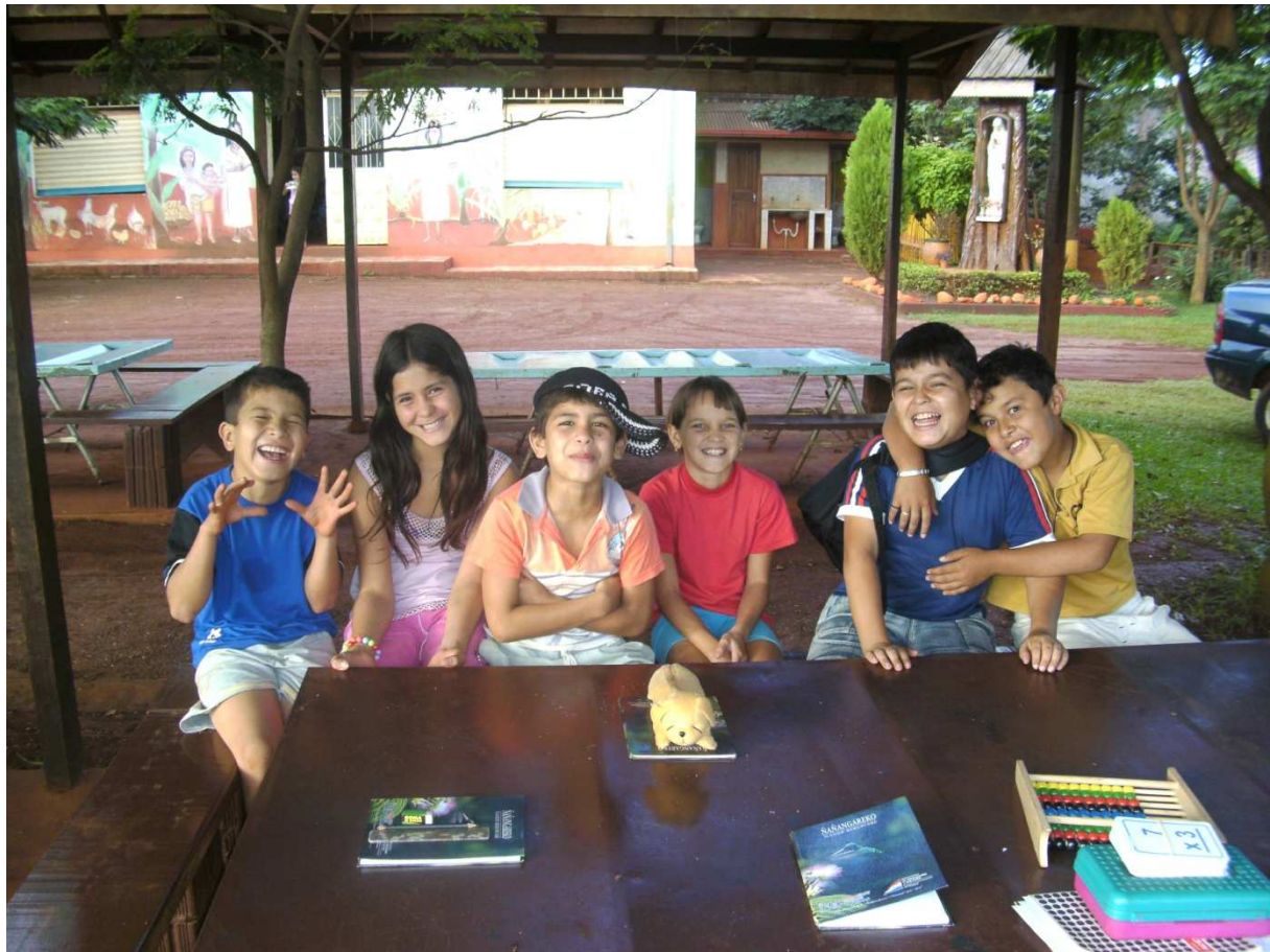
Das sind meine 6 Musterschüler

Jedenfalls habe ich nachmittags 6 von den Schülern des Schnelldurchgangs, die einigermaßen fit sind, also lesen und schreiben können, aber eben noch lange nicht auf dem normalen Bildungsstand, ihres Alters sind. Sie haben große Rechtschreibprobleme, Konzentrationsschwierigkeiten, können nur Plusrechnen und lesen mit Schwierigkeit.