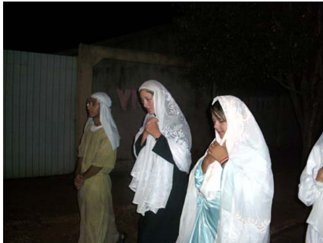
Auf dem Weg mit Johannes und Maria Magdalena

Am Karsamstag brachten uns dann die Leute von überall ihre selbstgemachten Chipa. Chipa sind sowas wie Brezeln bei uns, nur dass sie aus Maismehl und mit viel Käse gebacken werden. Die Tage vor Ostern, ist es dann Tradition sich als Familie zu versammeln und ganz viel davon zu backen. Von mehr als 15 verschiedenen Familien hatten wir dann ein paar Chipas. Ich konnte leider nicht so viel davon genießen, weil ich das meinem Magen dann doch noch nicht zutraute.