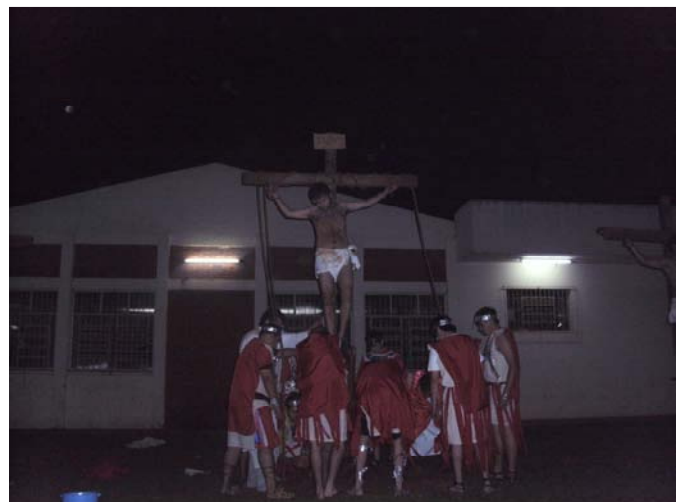
Jesus, wie er gekreuzigt wurde