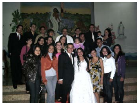
Die Jugendgruppe mit dem Brautpaar