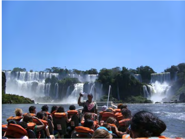
bei der Bootstour

Später durchforschten wir noch das riesige Gelände und machten schließlich bei einer 15 –minütigen Bootsfahrt mit, bei der man zuerst die Möglichkeit hatte, tolle Fotos zu machen und dann, nach dem man alle seine Sachen in wasserfeste Beutel verstaut hat einer kleinen Dusche, so nannten sie es unterzogen wird. Man fährt mit dem Boot, das auch oben auf dem Foto zu sehen ist voll in den Wasserfall rein. Es ist wie wenn man von einer Welle überspült wird, einfach gigantisch!