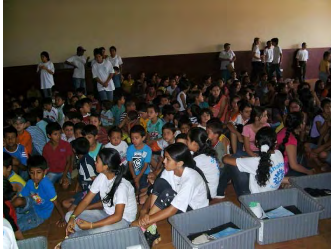
So sah es bei der allmorgendlichen Gebetseinheit aus (alle Leiter hatten weiße Shalom- T-Shirts)

konnten. Außerdem wurde um 8.00Uhr morgens immer eine kurze Leiterbesprechung mit den 80 Leitern gehalten, wo dann zum Beispiel besprochen wurde, wer nach diesem Vormittag, was putzt, was, wo noch nicht so ganz lief oder auch Zeit war zu sagen war, was einem besonders gut gefällt. Danach wurde per Powerpoint ein Gebet für alle Kinder und Leiter zusammen gesprochen und schon ging es mit der ersten Einheit los. Es wurde unter anderem Tanz, flöten, basteln, Hockey, Fussball, Volleyball, Singen, Bibellesen, Bibliothek, Wissenswertes über unserer Umwelt und Brettspiele angeboten.