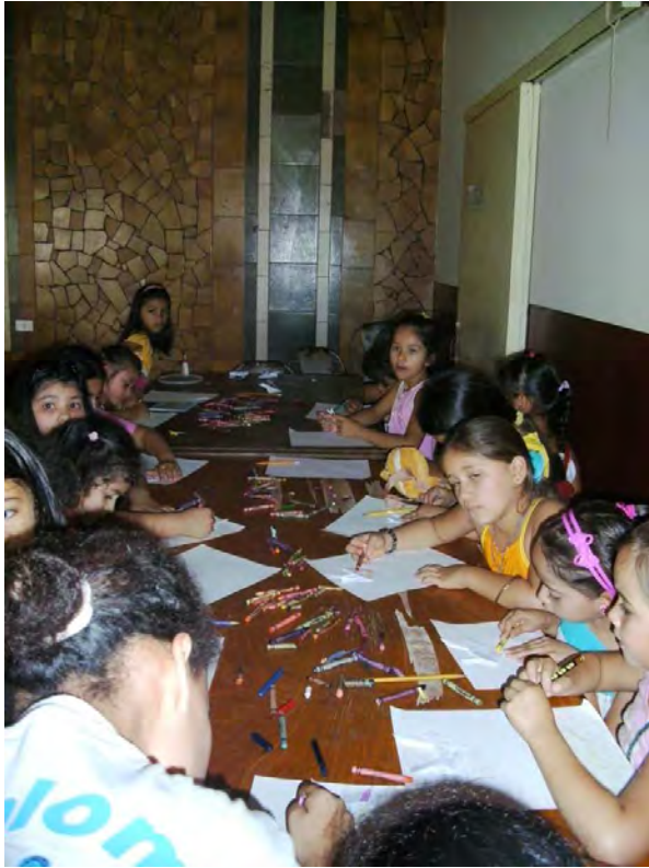
Die 9er Mädels beim Origami