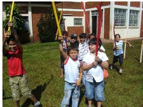
Die 9er Jungs beim Hockey