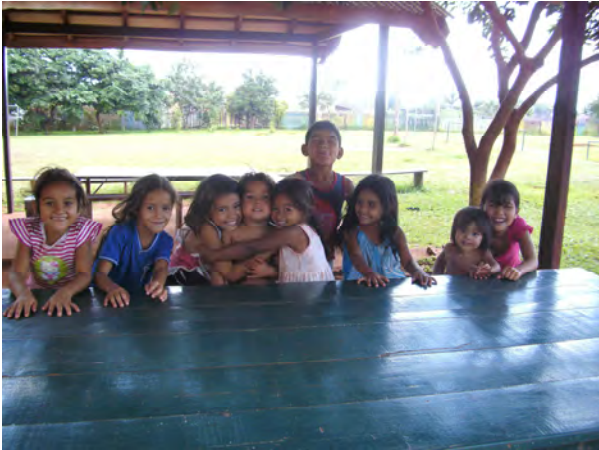
Nach 3 Stunden spielen ist der Durst groß