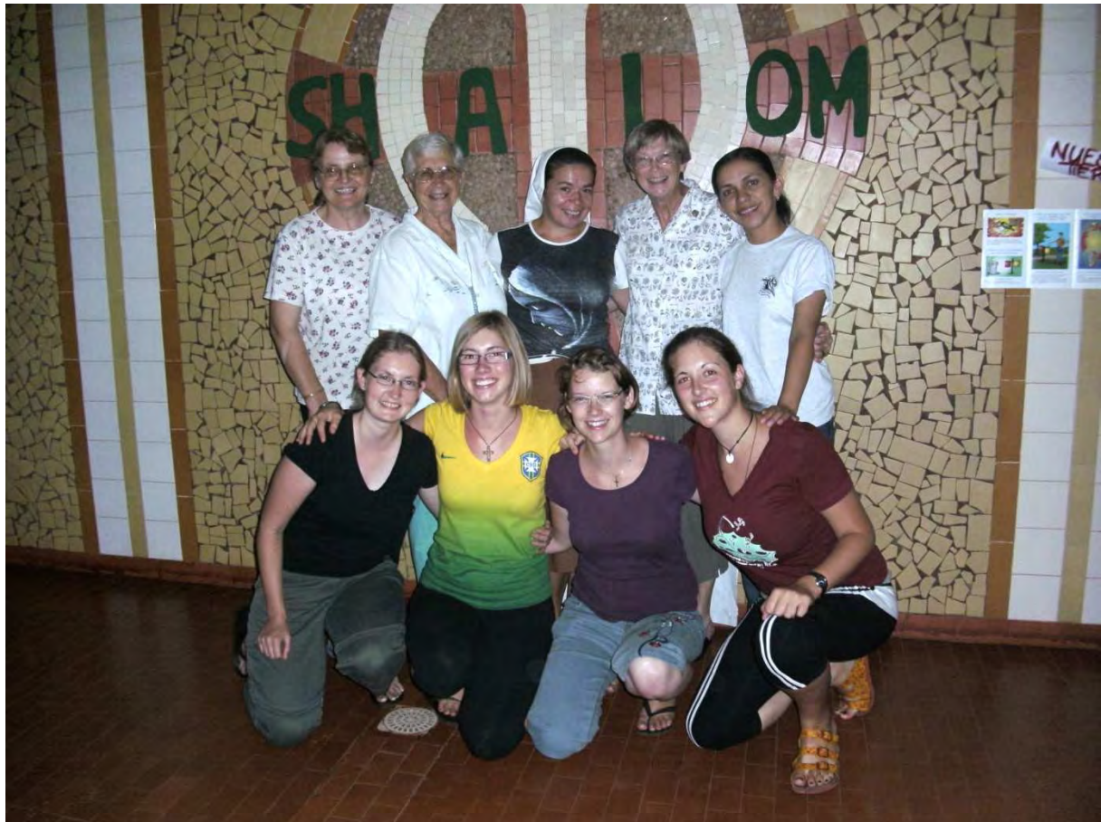
Hinten die 5 Schwestern, vorne die 4 MaZ-lerinnen → Club de verano Gemeinschaft

Nun aber zurück zu Club de verano. Die ganze Aktion stand unter dem Motto „Shalom – un estilo de vida“ was soviel bedeutet wie „Frieden- ein Lebensstil“. Mit diesem Motto konnte man wirklich viel anfangen. Vom Schützen der Erde, Umgang untereinander, Friedenslieder singen bis hin zu korrektem Verhalten im Sport oder Friedenstauben und Freundschaftsbändchen basteln. Es war für paraguayische Verhältnisse alles ziemlich gut organisiert und es war ein wunderschönes Gefühl den ganzen Vormittag und auch sonst, wenn man eines der 300 teilnehmenden Kinder irgendwo in der Stadt traf mit einem fröhlichem „Shalmo“ begrüßt zu werden.