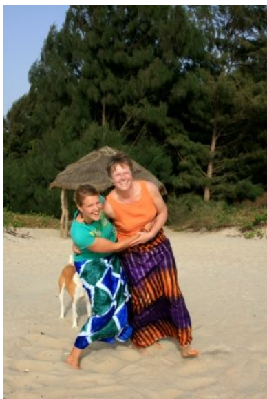
Mutter - Kind - Beziehung