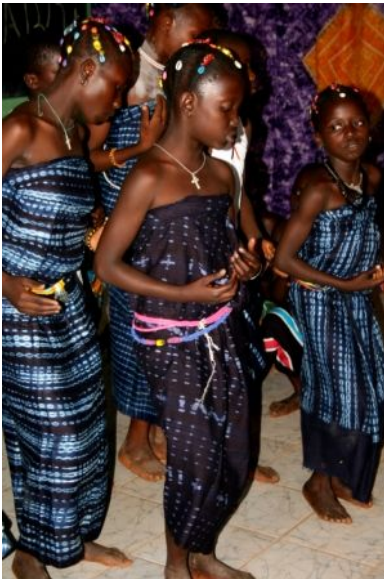
Wettbewerb in Tanz und Gesang