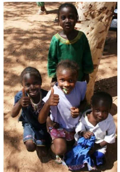
viel Freude und Hoffnung

Da wir den besagten Konkurrenz kampf umgehen wollten, hatten wir beschlossen keinen ernsthaften „competition“ daraus zu machen. Zwar war es immer noch ein Wettbewerb zwischen den Kindern der verschiedenen Gemeinden, doch sollte es in erster Linie ein fröhliches Zusammentreffen, Kennenlernen und Austauschen von Erfahrungen sein. Die Diözese Banjul ist in 3 „Zonen“ aufgeteilt. In unserer Zone (Zone 3) haben 5 Gemeinden im Theaterspielen, Singen, Tanzen, Bible Quiz und Fußball bzw. Athletics teilgenommen. Geprobt wurde dafür teilweise bis in die Nacht hinein und unsere Kinder haben den 1. Platz für das Theaterstück erreicht und sich somit für das „Final Competition“ qualifiziert!!