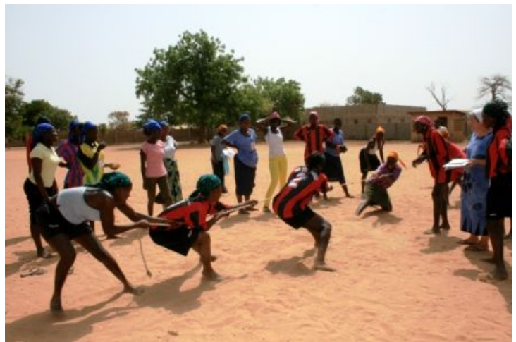
Seilziehen bei 47°C