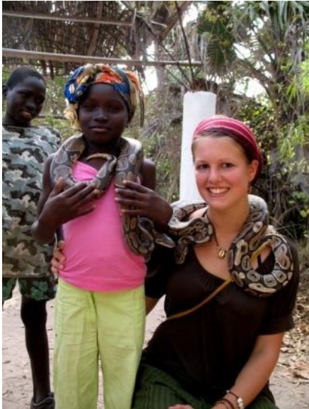
Keine Angst vor Schlangen...