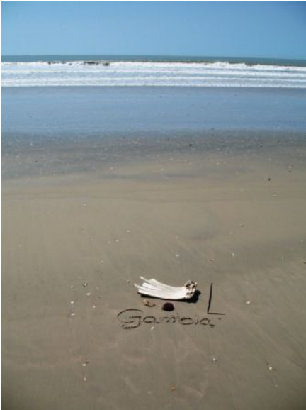
Strand bei Tanji

Hiermit sende ich Ihnen/Euch wieder einmal herzlich liebe Grüße aus dem immer heißer werdenden Gambia (ca. 47°C im Schatten.....gefühlte 90° C ;-))...doch mein Motto ist, wenn man die Hitze ignoriert, klappt es um einiges besser!! Denn angenehme Raumtemperaturen findet man nur im Kühlschrank ;-) Mein letzter Report ist schon wieder einige Zeit her, doch es kam einfach eins zum anderen und für Berichte schreiben blieb wenig Zeit. War es dann doch mal etwas lockerer, habe ich die Zeit meist genutzt um mich ein wenig auszuruhen oder mir für meinen Nachhilfeunterricht Übungsaufgaben auszudenken.