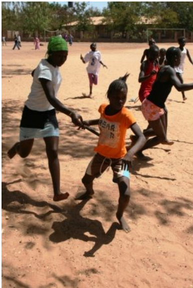
Staffellauf bei 46°C