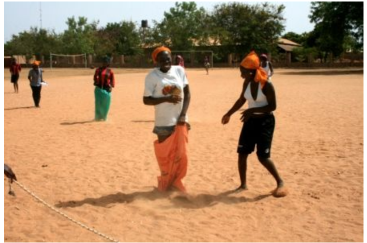
Sackhüpfen bei 45°C

Das ganze Programm hat sich bis in den Nachmittag gezogen und für das Sieger-Team gab es sogar Medaillen und einen tollen Pokal, was unter großem Jubel entgegengenommen wurde.