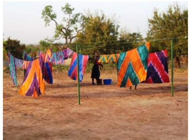
T-ide Stoffe unserer Schülerinnen