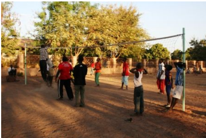
unsere neue Volleyball Anlage mit TSV -Zorneding Netz