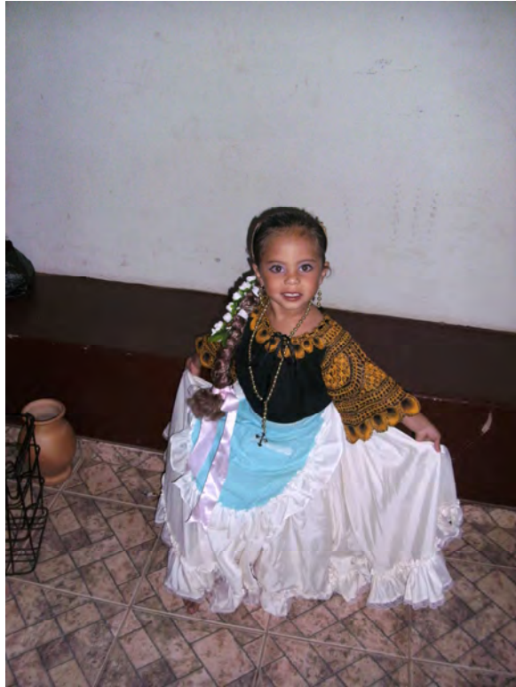
eine kleine Tänzerin (3) für den Bischof