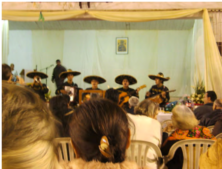
Eine typische musikalische Darbietung für den Bischof