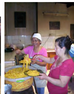
und dazu lecker Nudeln