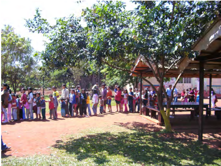
150 Kinder bekommen noch eine Süßigkeit bevor sie nach Hause gehen

denen viele dreckige oder löchrige Kleidung tragen. Vor kurzem waren wir bei einer Familie zu Besuch. Diese Familie lebt zu sechst in einem Haus, oder in einem hausähnlichen Gebäude. Es ist nicht größer als ein großes Zimmer, es hat keinen Boden sondern nur die normale Erde von draussen und ist zu vergleichen mit einem Gartenhäusschen. Gekocht wird draussen auf dem Gasherd oder der Feuerstelle. Wenn es kalt ist oder regnet sind alle im Bett, weil es dort noch am wärmsten ist. Trotz allem handelt es sich bei dieser Familie um eine sehr lebensfrohe und glückliche Familie. Ich bin immer wieder aufs Neue erstaunt wie glücklich und positiv die Menschen hier trotz aller Armut sind.