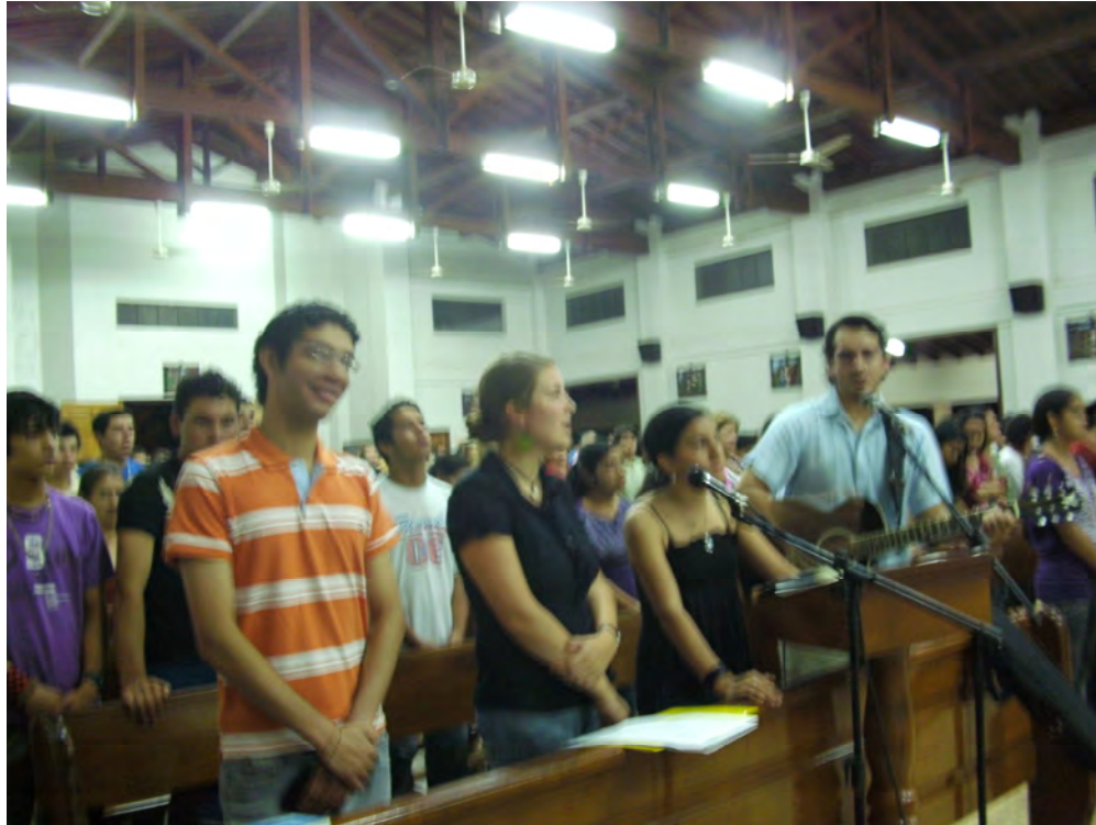
beim Singen in der Messe

Ein Junge der hier immer mit uns in der Kirche singt ist 20 Jahre alt. Er arbeitet montags bis samstags jeden Tag von 7.30 Uhr bis 18.30 Uhr, hat eine Mittagspause von einer Stunde und zusätzlich dienstags bis freitags jeden Tag ab 18.30 Uhr Kurse an der Uni. Sein Studiengang macht ihm keinen Spass, aber es ist die einzige Möglichkeit um irgendwann mal oberhalb der Armutsgrenze zu leben. Er hat mir von seinem Gehalt erzählt und gemeint, dass er zwar viel arbeiten müsse, aber dadurch auch ziemlich gut verdiene. Er arbeitet wie gesagt 66 Stunden in der Woche und sein Gehalt beträgt umgerechnet 120 Euro, MONATLICH!!! Spätestens ab diesem Gespräch habe ich versucht aufzuhören Paraguay ständig mit Deutschland zu vergleichen, denn es ist auf keinsten Weise zu vergleichen. Nach meinem ersten Frisörbesuch hier, kann ich aber auch verstehen warum man stolz auf 120 Euro im Monat sein kann und damit gut über die Runden kommt. Ich habe mir die Haare alle auf eine Länge und ein bisschen kürzer schneiden lassen und habe dafür umgerechnet nicht mal 2 Euro gezahlt und ich war sehr zufrieden.