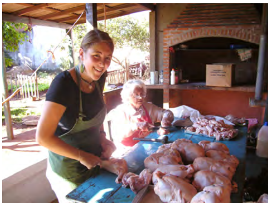
bei der Arbeit

Zum Abschluss möchte ich nun aber lieber wieder was schönes berichten. Seit dem 21. September haben wir hier ja Frühlingsbeginn und nun zeigt mir das Land erst richtig wie schön es blühen kann. Wir hatten zwar auch im sogenannten Winter blühende Orchideen usw. aber nun blüht es einfach überall. Gestern hatten wir 32 Grad und es war richtig schön, durch den starken Wind der aber ging, hat man die Hitze gar nicht richtig gespürt und ich hatte abends fast einen Sonnenstich weil ich das Trinken so ziemlich vergessen hatte. Außerdem haben wir an diesem Tag hart gearbeitet, da wir wieder Essen zubereitet und verkauft haben, um Geld für Topasy Roga einzubringen. Wir verkauften Taillarin. Das ist ein typisches Gericht mit Nudeln, Hühnchenstücken, Tomatensoße, Käse und natürlich sehr, sehr viel Öl. Da wir 150 Tickets verkauft hatten, mussten wir schon einen Tag vorher mit den Vorbereitungen anfangen. So durfte ich am Samstag 21 Hähnchen auseinandernehmen, diese Arbeit hätte ich mir auch niemals erträumt. Zuerst ekelte ich mich natürlich ziemlich und mein Magen spielte ein bisschen verrückt, dann aber musste ich wohl oder übel mit anpacken, weil mir eben gar nichts anders übrig blieb und zum Schluss war es dann doch gar nicht so schlimm. Nach den zwei Stunden roch ich zwar so dermaßen nach Hühnchen, das ich Angst hatte selbst eins zu werden, aber diese Vorstellung trat dank einer kalten Dusche nicht ein.