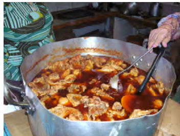
so sah es dann gekocht aus