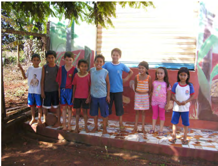
die momentane Besetzung des Chors in Topasy Roga