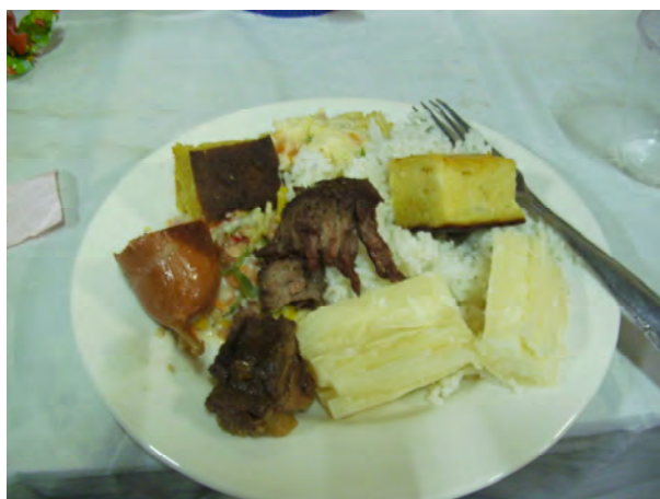
das Geburtstagsessen (Reis, Maniok, Sopa Paraguaya, Fleisch) die Geburtstagstorte