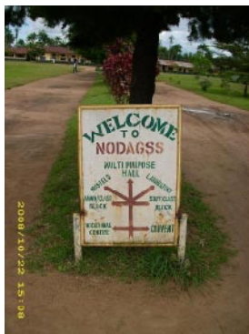
Einfahrt zum Schulgelände