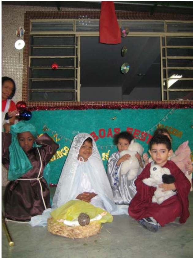
Maria, Josef, Jesuskind, Hirten mit ihren Tieren ;)...