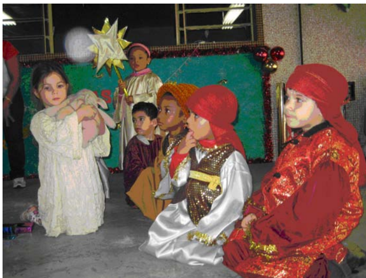
Und schliesslich: der Stern zu Bethlehem und die drei Weisen aus dem Morgenland.

Weil die Kinder einfach zu goldig waren... diesmal ein paar Fotos mehr 😊 Ein Grossteil dieser Kinder hat uns altersbedingt dann uebrigens auch mit diesem Tag verlassen, so dass sich natuerlich auch ein bisschen traurige Stimmung in diesen Abend eingeschlichen hat, der ansonsten sehr schoen war.