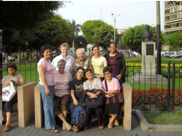
... und hier mal mit allen Schwestern)