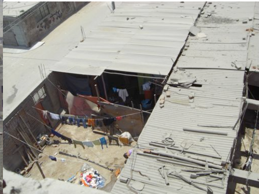
(und auch hier wurde Weihnachten gefeiert – eine andere Lebensrealität)

Und als wichtigste Vorbereitung auf Silvester wurde mir gesagt, dass alle sich gelb anziehen – als Farbe der Freude... Nun, ich ging davon aus, dass ein gelbes T-shirt damit gemeint sein könnte und eventuell noch gelbe Hose (falls man diese denn hat). Als ich dann am 31. Dezember allerdings auf den Markt zum Lebensmitteleinkauf ging, wurde ich eines Besseren belehrt... Es gab so ziemlich alles in gelb! Angefangen von T-shirts, Hosen, Röcken, Socken, Sonnenbrille bis hin zur Unterwäsche! Ich habe mich mit gelben T-shirt zufriedengegeben und obwohl tatsächlich viele Leute sehr "gelb" in dieser Nacht angezogen waren, gingen auch viele in anderen Farben aus. An diesem Abend haben wir dann schon vor der Messe zu Abend gegessen und um 10.00 Uhr war dann Gottesdienst. Und hier haben sie einen – wie ich finde – sehr schönen Brauch für den Gottesdienst auf Silvester. Während der Messe schreibt jeder auf einen Zettel die Dinge, die er hinter sich lassen will oder die nicht gut waren, die Vorhaben dessen, was man nicht mehr machen will im neuen Jahr. Nach der Messe wurden diese dann verbrannt in einem grossen Feuer auf dem Pfarrplatz mit der gesamten Pfarrgemeinde. Nach Tee und Brot für alle und natürlich